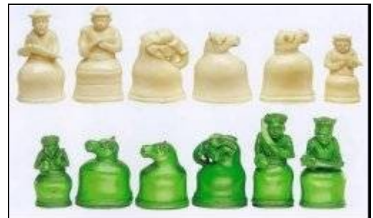
конец 19 века