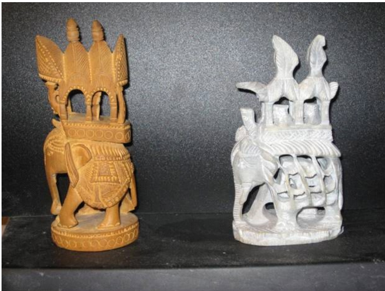
современные индийские фигуры (санда, мрамор)

В Индии такие фигуры часто продаются на улице в качестве сувениров, при этом их назначение не объясняется.