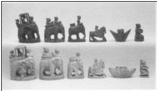
Бенгалия, середина 17 века

Древнюю боевую колесницу заменяли лодкой, наездниками (на лошадях 1 и верблюдах 2 ), иногда башней. Вводились другие дополнительные фигуры.