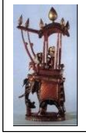
раджа, Индия, 18 или 19 век