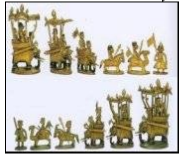
Раджастан, середина 19 века