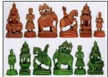
юг Индии, конец 18 века