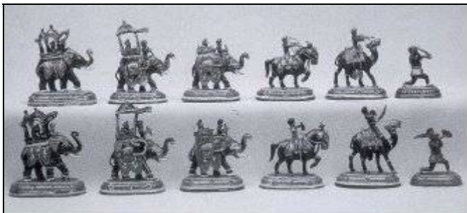
Джайпур, середина 19 века