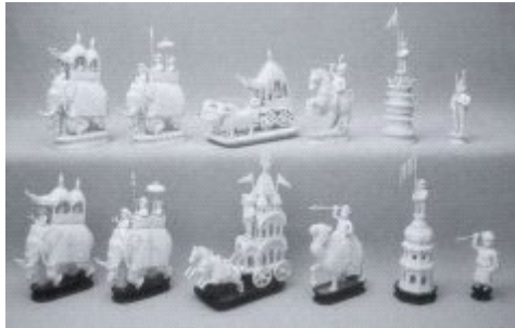
Берхампур, середина 19 век