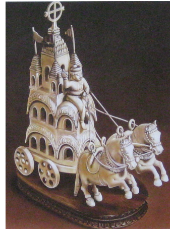
колесница Джаггернаута 1